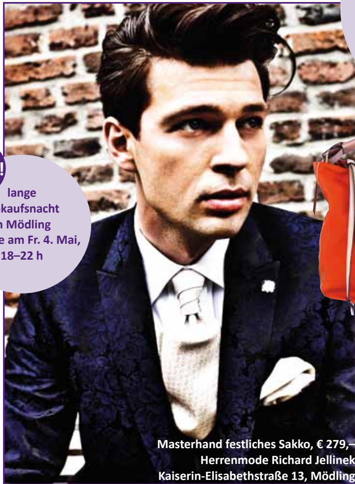
Masterhand festliches Sakko, € 279,- Herrenmode Richard Jellinek Kaiserin-Elisabethstraße 13, Mödling

Neue Frühling/Sommer Krawattenkollektion Preis ab € 26,- Burg Hemden Franz Josef Straße 6, Perchtoldsdorf