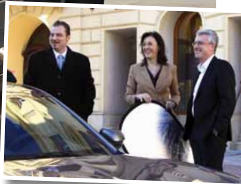
Staunen in der FuZo Mödling