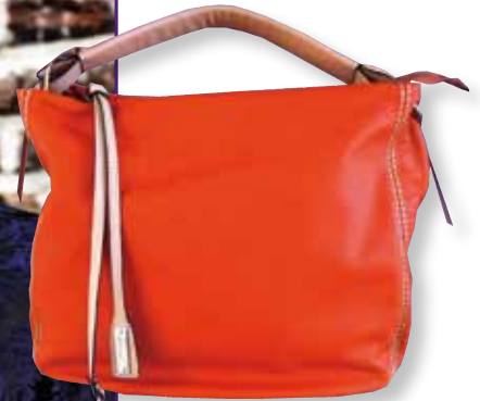
Abro Ledertasche, € 215,- BaG 2345, Teichgasse 3, Brunn am Gebirge