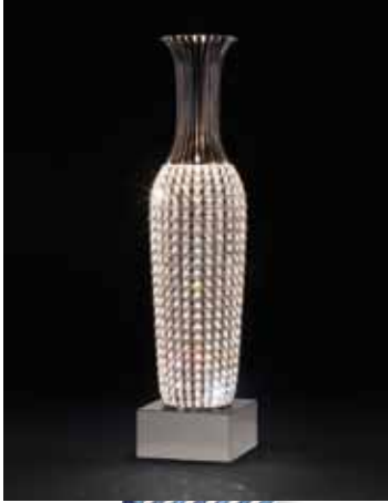
Kristall-Bodenleuchte mit Swarovski Vollschliff-Kristall Maße: d 30 cm, h 130 cm, € 6.768,- Dotzauer Decorative Lighting Franz-Schubert-Straße 15, Brunn am Geb.

Der Handel in der Region bietet persönlichen Service und vor allem eine große Vielfalt an Einkaufsmöglichkeiten, auch abseits der Shopping City Süd. Bei uns finden Sie aktuelle Trends, Produktneuheiten und Ungewöhnliches.