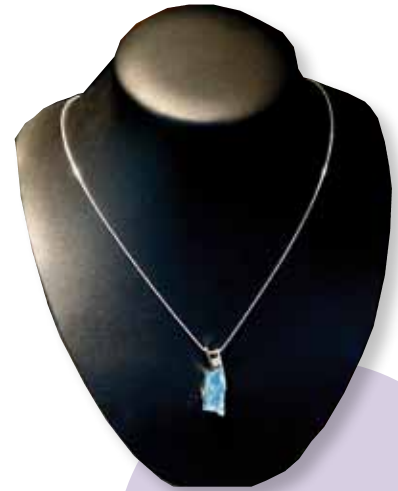
Weißgold-Aquamarincollier (5,48 ct.), Spiegelschliff, Altschliffdiamant, € 1.980,-, Juwelier Hammerschmid Leopold-Gattringer-Straße 16, Brunn am Geb.